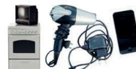
Déchets d'équipements électriques et électroniques