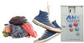
Vêtements, chaussures en sacs fermés dans les bornes "textile"