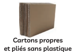
Cartons propres et pliés sans plastique