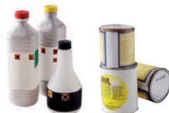
Produits chimiques des ménages