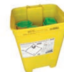
Déchets d'activité de soins à risque infectieux

Les produits chimiques et leurs emballages doivent être bien étiquetés et déposés uniquement en déchèterie.