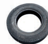
Pneumatiques de voiture