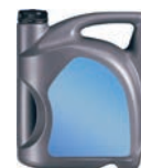
Huile de vidange