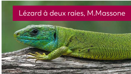
Lézard à deux raies, M.Massone

animaux : rapaces, faisans, goélands, sangliers, renards, blaireaux, chats, brochet etc.