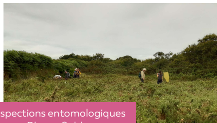
Prospections entomologiques aux Blancs Sablons, Le Conquet 2024

Encore un peu de patience, et en attendant allons observer la nature !